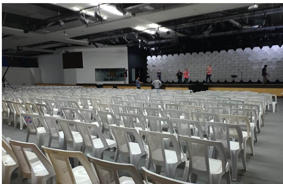
Auditório 1200 lugares