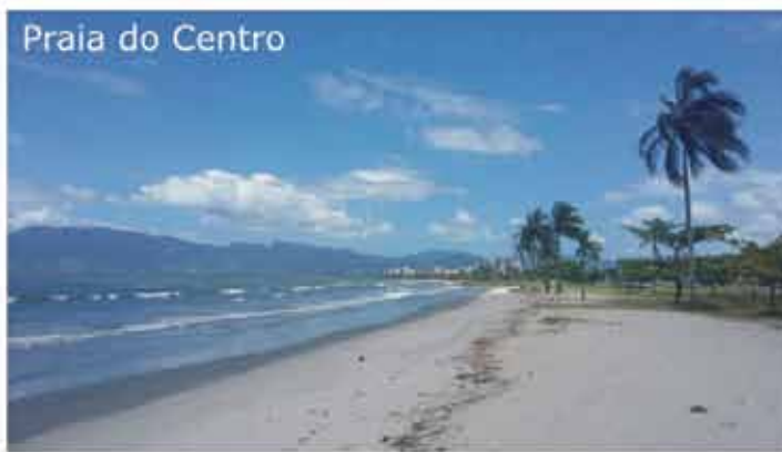
Praia do Centro