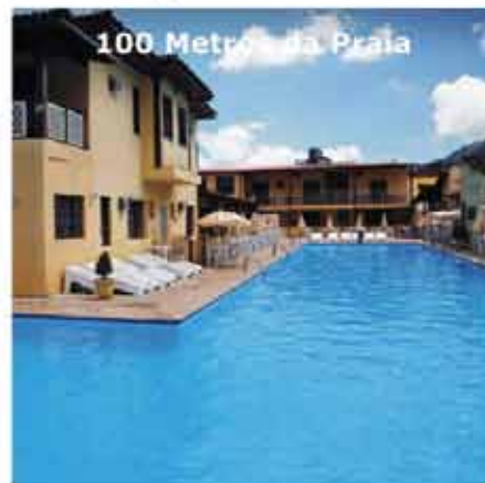
100 Metros da Praia

Capacidade 500/600 P - 221 - Aptos * Total Hotel Mar + Hotel Caraguatatuba