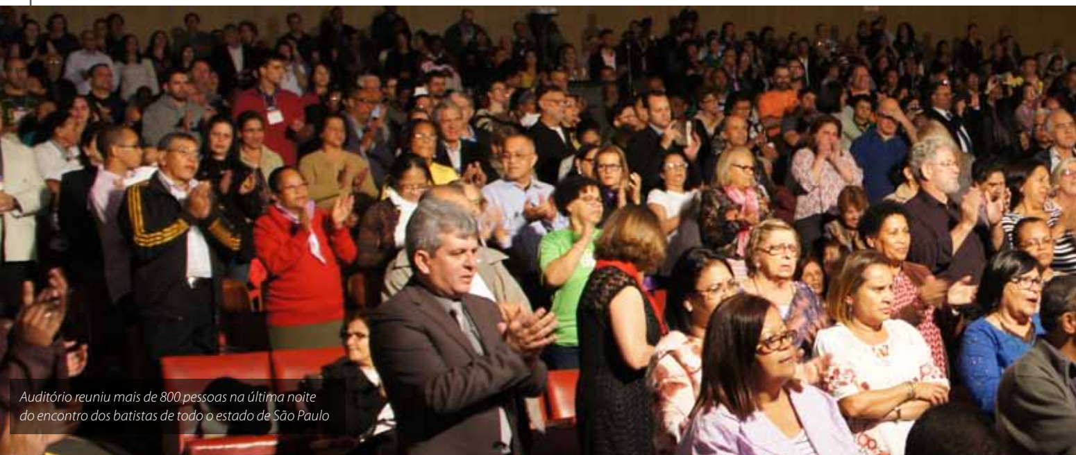
Auditório reuniu mais de 800 pessoas na última noite do encontro dos batistas de todo o estado de São Paulo