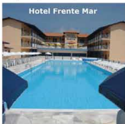
Hotel Frente Mar

Somente para Igrejas - Diárias por Pessoa de 99,00 até 31/Ago e 115,00 até 20/Nov/2017 c/ café da manhã, almoço e jantar. Consumo a parte lanchonete!