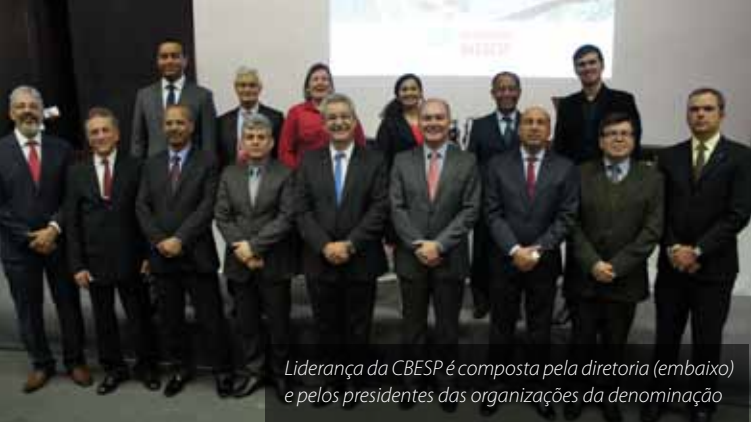
Liderança da CBESP é composta pela diretoria (embaixo) e pelos presidentes das organizações da denominação

a conexão com o Congresso Multiplique. “Um crescimento em número e em profundidade - esse é imperativo para igrejas fortes e para uma denominação forte. Creio que a Convenção está de parabéns pelo seu desempenho e pelo desenrolar de seu programa nesta Assembleia”, afirmou.