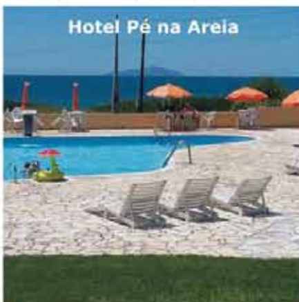
Hotel Pé na Areia