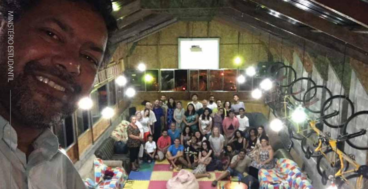
Auditório ARIMAX, o último piso da Casa – Toca, inaugurado em 31 de Dezembro de 2016 e a Igreja reunida