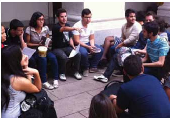
NEB - Nosso grupo mais antigo em seu encontro regular - USP